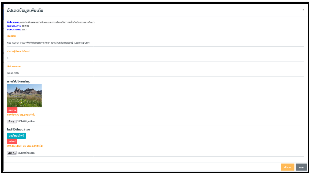
( ภาพที่ 3 หน้าอัปเดตข้อมูล )

2.8 อัปเดตข้อมูลเพิ่มเติม (ปุ่มสีฟ้า) : ใช้สำหรับอัปเดตข้อมูลโครงการเพิ่มเติมที่อาจไม่ได้ดึงจากระบบอัตโนมัติ ( ภาพด้านล่าง )